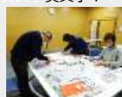
夢中になって楽しい♪