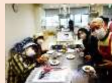
楽しく交流出来ました