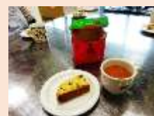
イギリス紅茶とシュトーレン