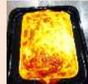
美味しく出来あがりました